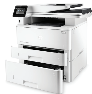
МФУ HP LaserJet Pro M426fdw с дополнительным лотком подачи бумаги на 550 листов